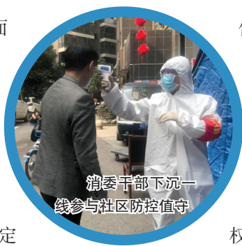
消委干部下沉一线参与社区防控值守

认真筹备精心组织开展3·15活动。 结合鄂州市疫情实际，制定方案，组织了别开生面的线上3·15宣传热潮。在3·15活动期间，共发布“3·15”宣传公益信息一百万余条，发布新闻宣