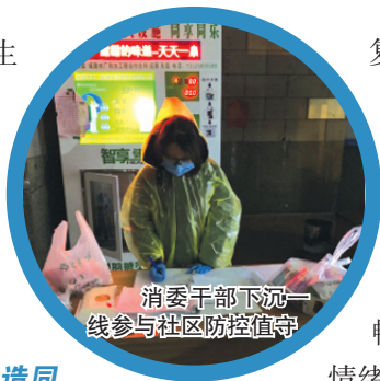
消委干部下沉一线参与社区防控值守

复工复产阶段，各类市场主体要求尽快恢复经营的呼声高涨，3月13日，宜昌市市场监管局、市消委联合发布了《关于做好陆续复工复产期间消费维权工作的工作提示》，确定了“应对有温度，答复有准度，处置有速度”的工作方法，准确把握复工